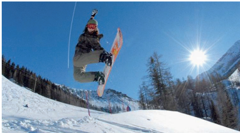
VERMEHRT AUCH VON DER SO GENANNTEN „HOLDEN WEIBLICHKEIT“ FREQUENTIERT: DIE ERFOLGREICHEN ASVOÖ POWER CAMPS MIT DEN STATIONEN HOCHFICHT UND ZAUCHENSEE.