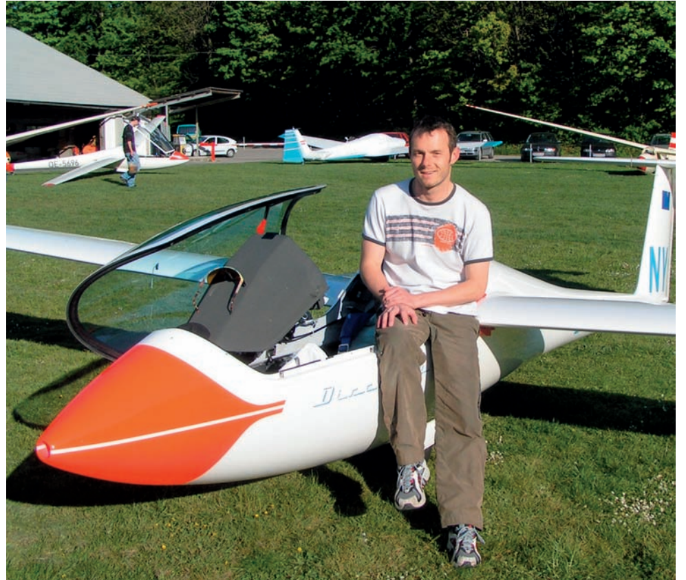
DIE RIEDER SPORTFLIEGER TRUMPHEN 2008 MIT SPORTFLIEGER WELTMEISTERSCHAFTEN AUF EIN NEUES KLUBHAUS SAMT TOWER WERDEN IM RAHMEN DIESER WELTMEISTERSCHAFTEN OFFIZIELL IN BETRIEB GEHEN.

Der Sportfliegerclub Ried und sein Flugplatz in Kirchheim sind die Gastgeber der vom 13. bis 26. Juli stattfindenden Sportflieger Weltmeisterschaften in den Disziplinen „Präzision“ und „Navigation“. Für ein Ereignis dieser Kategorie, so der Sportfliegerclub, seien natürlich umfangreiche Adaptierungsmaßnahmen erforderlich. Die anstehende WM in Ried wirft also ihre Schatten zunächst einmal in Form von Ärmel hochkrepeln und Zupacken, also in Form von Arbeit voraus: Unmittelbar neben dem Hangar wird ein funkelnelagener Tower errichtet; das Betriebsgebäude wird hochwassersicher umgestaltet; beim Clubheim erfolgt ein Zubau und auch das Restaurant wird