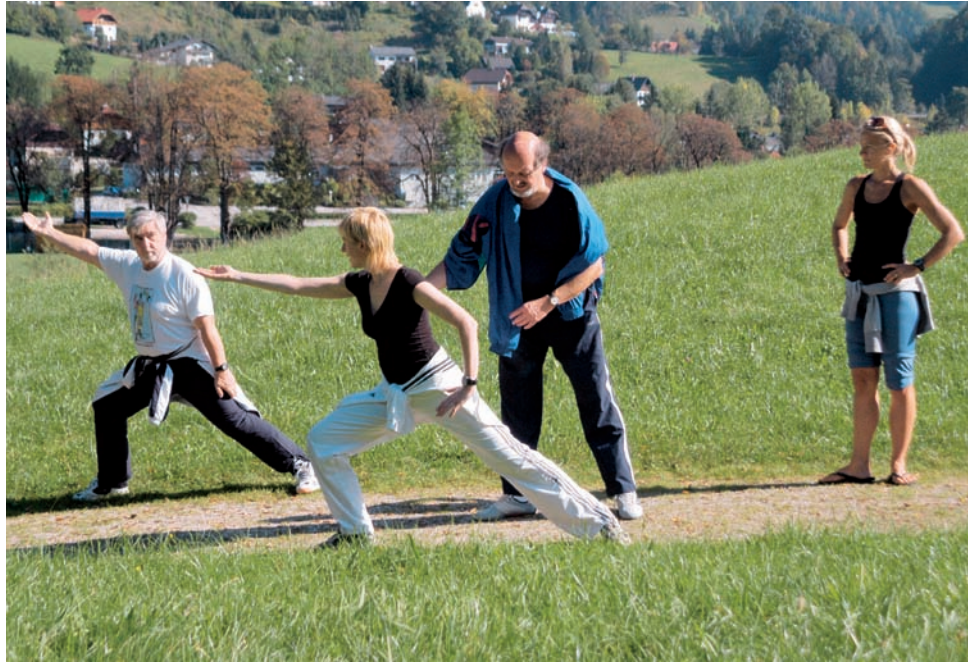
DER ASVÖ BIETET AUSBILDUNG VON JUGENDBETREUUNG: DEN SPORTINTERESSIERTEN - WISSEN UND GRUNDLAGEN ZUR ORGANISATION, VORBEREITUNG UND PLANUNG VON SPORTWOCHEN, TRAININGSLAGERN ZU VERMITTELN.

Die Ausbildung wird an drei Wochenenden, jeweils Freitag bis Sonntag, angeboten. Teil I vom 25. bis 27. April 2008 in Obertraun, Teil II vom 12. bis 14. September 2008 in Salzburg-Rif und Teil III vom 16. bis 18. Jänner 2009 in Rohrmoos. Teil I beschäftigt sich mit Themen wie Jugendsoziologie, Methodik, Teambuilding, Kennenlernspiele, große und kleine Spiele in der Halle, im Freien, Erlebnisspiele, Geländespiele, Outdoor games, etc.; im Teil II geht es um Kursplanung, also um Organisation, Durchführung und Nachbearbeitung, weiters um vorbeugende und Sofortmaßnahmen der Ersten Hilfe bei Sportverletzungen - speziell im Jugendbereich, Spiele im Wasser unter Einbeziehung von Schwimmunfällen, etc.; Teil III beschäftigt sich