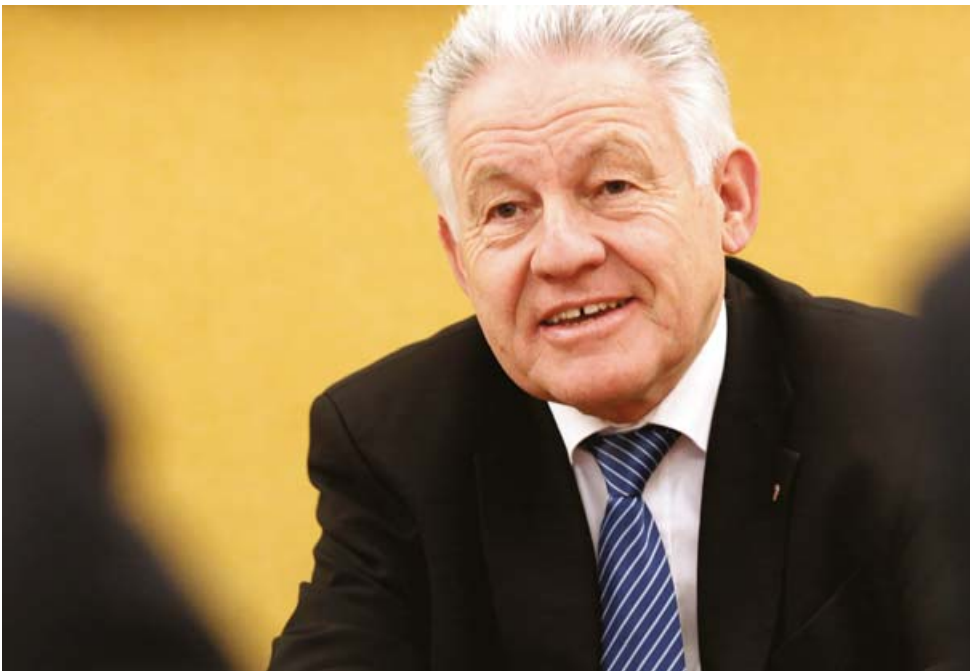
DR. JOSEF PÜHRINGER: LANDESHAUPTMANN OÖ.

LH. DR. PÜHRINGER: Meine Frau und meine Kinder haben mich bei meiner Entscheidung bestärkt. Sie sind für mich eine große Kraftquelle. ■