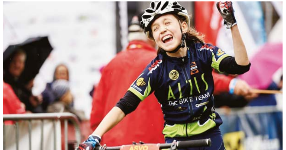
WIE SICH SPORT, ES SCHAFFEN, SIEGEN ANFÜHLT? EIN BILD SAGT MEHR ALS TAUSEND WORTE...; (FOTO: GERGELY TIMAR)